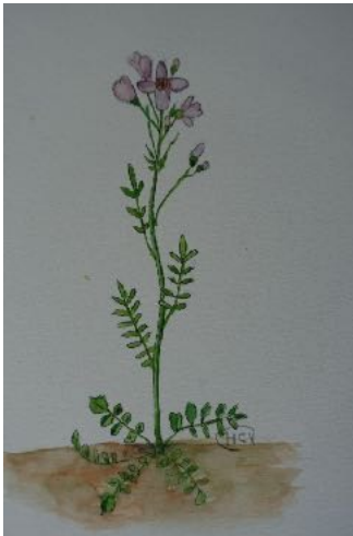
Aquarel Henk Vonk 'De Pinksterbloem'

U kunt uw bijdrage voor het volgende kerkblad per e-mail inleveren: kerkblad@bavo.nl